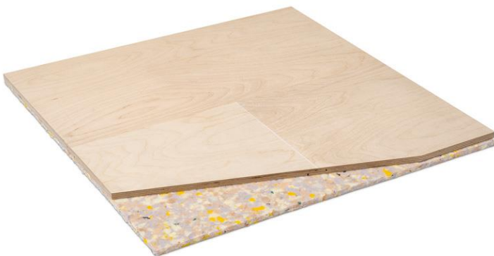
Illustrasjon: Titan PW Elite 30.